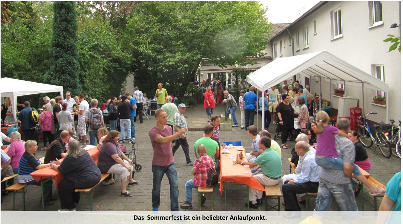
Das Sommerfest ist ein beliebter Anlaufpunkt.

Am 1. September von 12 bis 17 Uhr in der Schmitzbauerstraße 9