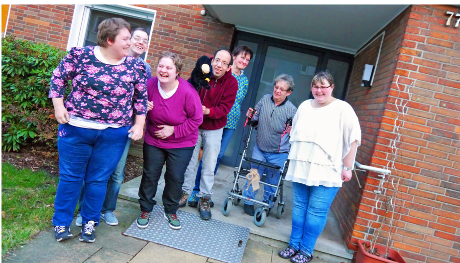
Wohngemeinschaft Tilsiterstraße: vorbereiten für die Selbstständigkeit.

Die Außenwohngruppe für Menschen mit Behinderungen gehört zur Theodor Fliedner Stiftung, insgesamt bietet die Stiftung in Mülheim 24 Außenwohnplätze. Sie können für viele Bewohnenden eine Zwischenstation auf dem Weg in die ersten eigenen vier Wände sein. Unter der Woche ist zwischen 16 und 21 Uhr eine Betreuungsperson vor Ort, am Wo-